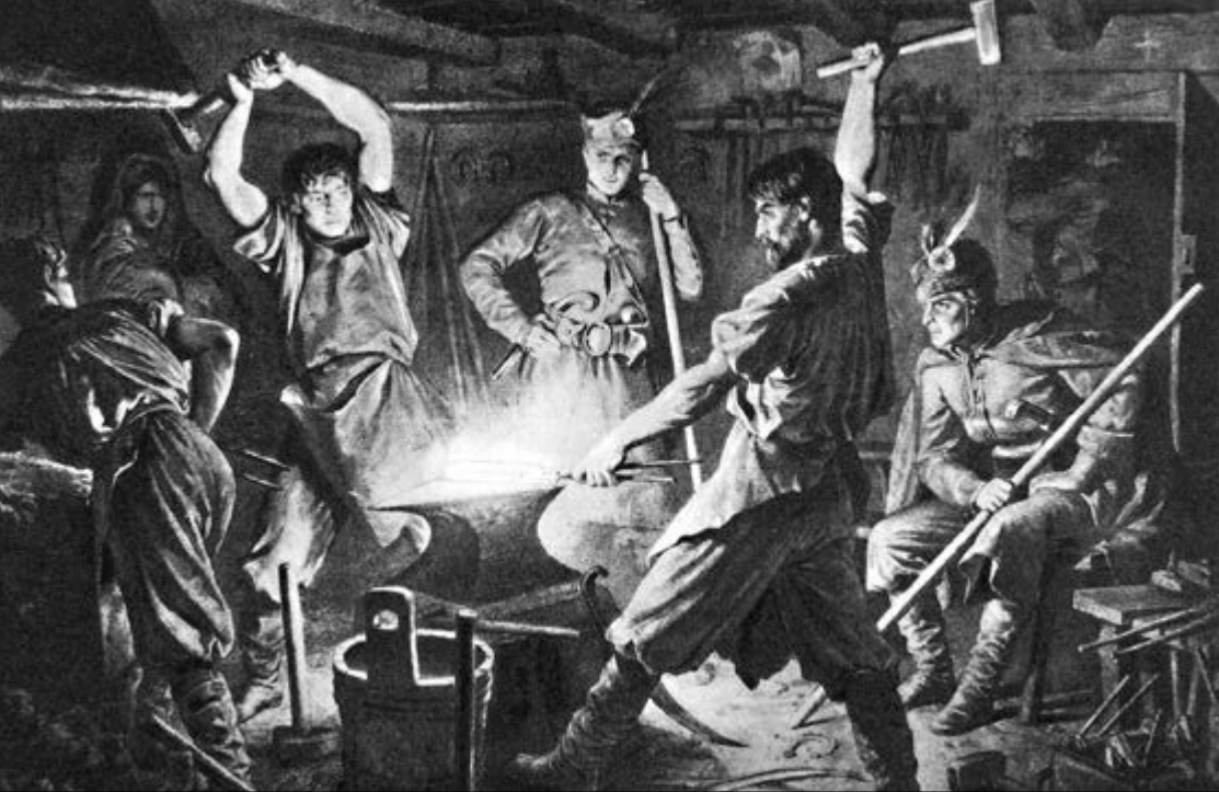
Artur Grottger, Kucie kos

rozbity został oddział Sierakowskiego, a dowódca dostał się do niewoli. Mimo bohaterstwa niewyszkolone i słabo uzbrojone oddziały powstańcze nie były w stanie zmierzyć się z regularną armią rosyjską. Klęska oddziału Sierakowskiego była poważnym ciosem dla powstania na Litwie, ponieważ na ziemiach litewskich była to faktycznie jedyna próba zawiązania powstańczej armii. Nie został również zrealizowany plan opanowania znacznej części kraju. Po dostaniu się Sierakowskiego do niewoli, dowództwo powstańcze na Litwie nie mało już jednolitego dowództwa ani skoordynowanego planu działania. Mimo to istniały jeszcze poważne siły powstańcze, nad którymi władze rosyjskie do końca lata nie mogły zyskać przewagi.