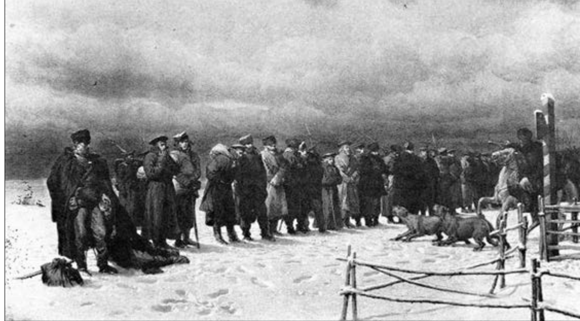
Artur Grottger, Pochód

Zarządzono sprzedaż majątków tych właścicieli dóbr, którzy zostali skazani drogą sądową, ale też właścicieli ziemskich zesłanych w głąb Rosji drogą administracyjną. Osobom, którym nie udowodniono udziału w powstaniu, ale które były podejrzane o kontakty z władzami narodowymi, nakazano sprzedaż swych majątków w ciągu dwóch lat. Drogą konfiskat zabierano ziemię należącą do drobnej szlachty, którą masowo przesiedlano do guberni permskiej i orenburskiej. Ukaz grudniowy z 1865 roku głosił, że „nabywcami wszelkich dóbr i gruntów polskich mogą być tylko rodowici Rosjanie, albo też miejscowi chłopci — nie katolicy i nie Polacy”. Podobne zasady stosowane były nie tylko na Litwie i Białorusi, ale też w Królestwie Polskim i na Ukrainie. Celem zachęcenia Rosjan do